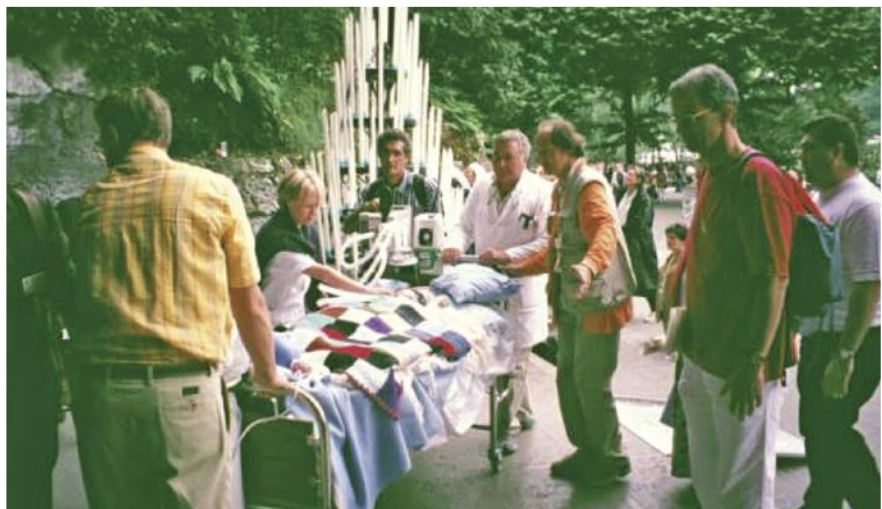
Avec quelle vigilance ces personnes assurent la sécurité de la personne handicapée respiratoire !

Si les personnes atteintes par la poliomyélite sont de moins en moins nombreuses, par contre, il y a de plus en plus de personnes accidentées avec des séquelles très handicapantes mais également de plus en plus de personnes qui souffrent d'insuffisance respiratoire lourde, et de personnes atteintes par exemple de sclérose en plaques et autres maladies paralysantes ; souvent, il s'agit aussi de personnes jeunes qui sont révoltées contre la vie et leur handicap. Plus souvent encore certains vivent dans la solitude et loin de l'église.