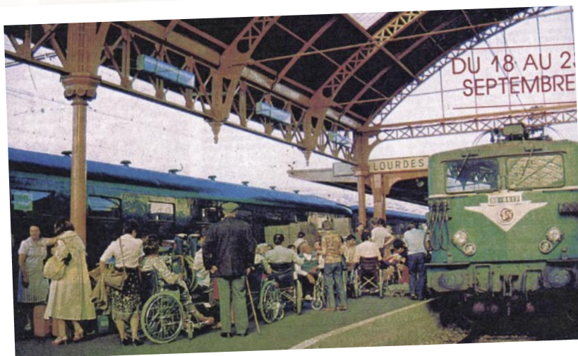
Arrivée en gare de Lourdes en 1983

Le « Pélé Polios » était né et fut depuis recommencé sur une périodicité de 5 ans, pour à la fois des raisons techniques difficiles à mettre en œuvre (transport d'oxygène, groupes électrogènes séparés de la voiture ambulance pour la marche des appareils respiratoires...) et le surcoût très important, conséquence de ces aménagements techniques.