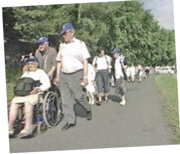
Montée à la Cité St Pierre

Comment rester fidèle à l'intuition de départ c'est-à-dire une rencontre conviviale dans un lieu de pèlerinage ?